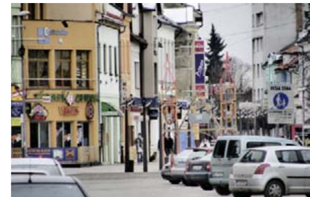
Martin ist ein regionales Zentrum und für die nationale Kultur der Slowaken von grosser Bedeutung.

land geliefert. Der hohe Exportanteil hat Tradition. Er war bereits hoch, als der Eisener Vorhang noch hing. Zwischen Kanada und Russland liefert Neografia a.s. mittlerweile (vor allem Periodika) in 23 Länder. Technologisch von der Druckvorstufe bis zur Weiterverarbeitung top ausgerüstet, sieht Generaldirektor Sporka die Stärke seines Unternehmens in der